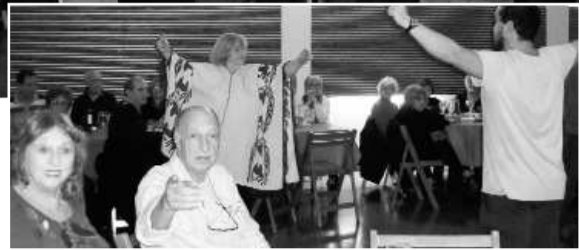
La alegría, el compañerismo, el baile y la música inundaron el lugar

No faltó el folclore y otros ritmos. Los jubilados participantes demostraron, una vez más, que la juventud se lleva adentro de por vida.