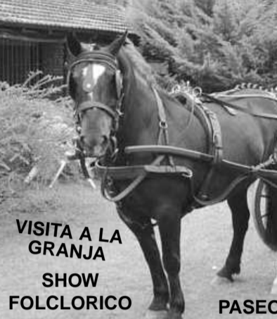
VISITA A LA GRANJA SHOW FOLCLORICO