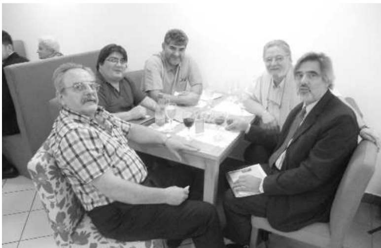
Vicepresidente (a/c presidencia), Secretario y Tesorero de CONAM Presidente de Mutual Gas con representantes de Río Gallegos.

A todo esto, el título de "Asamblea histórica" fue por el enriquecedor debate que se dio en torno a la unidad del movimiento mutual a nivel nacional, en el cual las exposi-