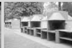
PREDIO PUCARA XIV Av. J. A. Roca 2778 - Moreno