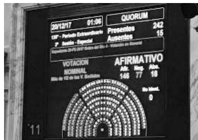
Nuestra satisfacción por la eliminación de los artículos 23 y 24 del Proyecto de Ley de Reforma Tributaria.

Destacamos el pequeño aporte realizado por Mutual Gas con sus escritos y acompañando a los directivos de la Federación y Confederación a las que está adherido, en diversas entrevistas concedidas por los legisladores.