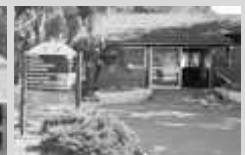
PREDIO PUCARA XII Av. Sarmiento 4040 - C.A.B.A.