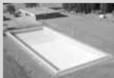
PREDIO PUCARA XIII a 3 Km. de Au. Richieri - Ezeiza