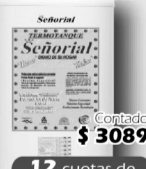
Termotanque Seniorial - 85 lts.