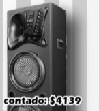
Kioto Baffle Potenciado Mod 3300