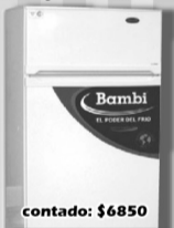
Bamby - Heladera