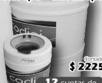
Combo Codini Secarropa + Lavarropa