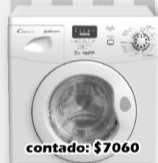
Candy Aut. Lavarropa 6.5 Kg