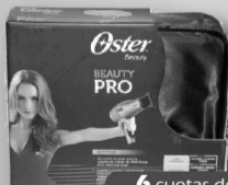
Secador Oster Pro con estuche