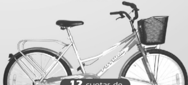
Bicicleta Dama Paseo Rodado 26