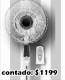
Clever Ventilador C/ Control