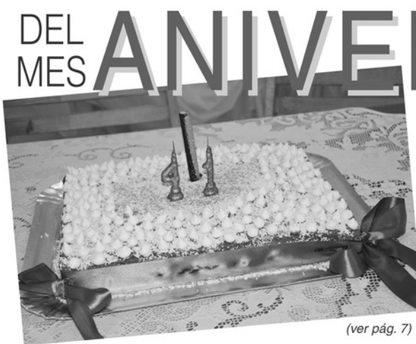
(ver pág. 7)