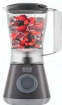
LICUADORA BLACK+DECKER 6 ctas. de $ 1.274,50