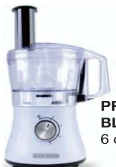
PROCESADORA BLACK+DECKER 6 ctas. de $ 1.678.-

Gran variedad de productos al MEJOR PRECIO FINANCIACIÓN HASTA EN 12 CUOTAS