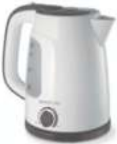
JARRA ELECTRICA SMARTLIFE 3 CTAS. DE $ 1.515