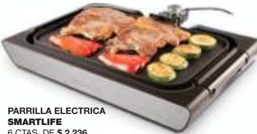
PARRILLA ELECTRICA SMARTLIFE 6 CTAS. DE $ 2.236