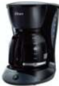
CAFETERA OSTER 6 CTAS. DE $ 1.259