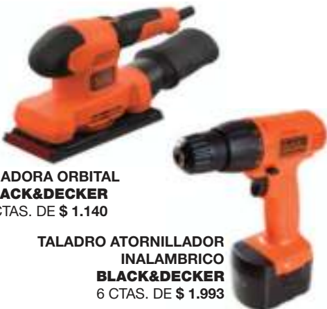
LIJADORA ORBITAL BLACK&DECKER 9 CTAS. DE $ 1.140