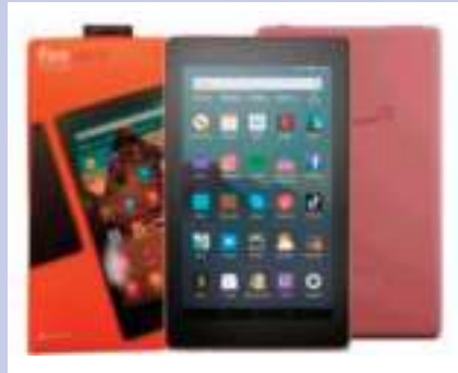
TABLET 10.1 AMAZON KINDLE FIRE HD 10 OCTACORE 2GHZ 2GB 32GB 1920X1200 WIFI DUAL BAND ALEXA EXPANDIBLE MICROSD HASTA 512 PLUM CONTADO $ 17.815 12 CTAS. DE $ 2.860