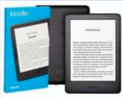
EBOOK READER AMAZON KINDLE 8GB TOUCHSCREEN WIFI 6 PULGADAS 167PPI DECIMA GENERACION NEGRO/BLANCO CONTADO $ 15.105 12 CTAS. DE $ 2.350