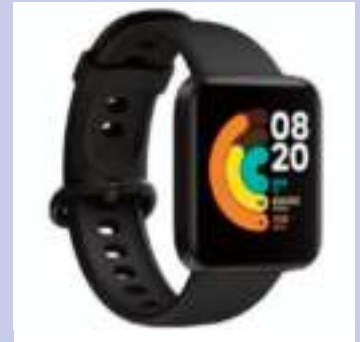
SMARTWATCH XIAOMI MI WATCH LITE RITMO CARDIACO MONITORIZACION DE SUENO GPS BATERIA 230MAH PANTALLA 1.4 PULGADAS 448X360X NEGRO CONTADO $ 7.840 12 CTAS. DE $ 1.250