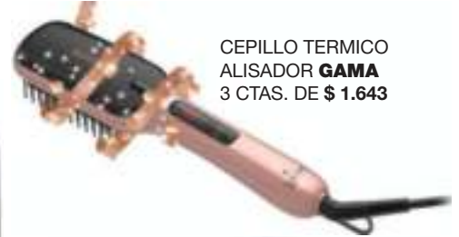
CEPILLO TERMICO ALISADOR GAMA 3 CTAS. DE $ 1.643