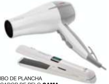
COMBO DE PLANCHA Y SECADOR DE PELO GAMA 12 CTAS. DE $ 1.096