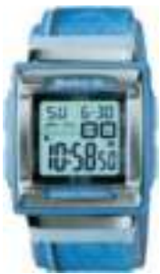
RELOJ CASIO BABY-G 3 CTAS. DE $ 3.007