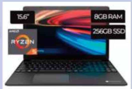
NOTEBOOK GATEWAY GWTN156 AMD RYZEN 5 3450U 2.1GHZ 8GB 256GB 1920X1080 15.6 PULGADAS WIN10 Y TECLADO EN INGLES NEGRA CONTADO $ 90.655 12 CTAS. DE $ 14.560