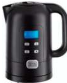
JARRA ELECTRICA BLACK-DECKER 6 CTAS. DE $ 1.450