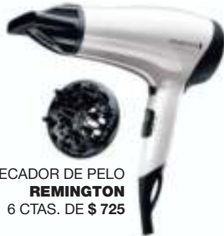
SECADOR DE PELO REMINGTON 6 CTAS. DE $ 725