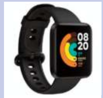
SMARTWATCH XIAOMI MI WATCH LITE RITMO CARDIACO MONITORIZACION DE SUEÑO GPS BATERIA 230MAH PANTALLA 1.4 PULGADAS 448X360X NEGRO CONTADO $ 7.840 12 CTAS. DE $ 1.250