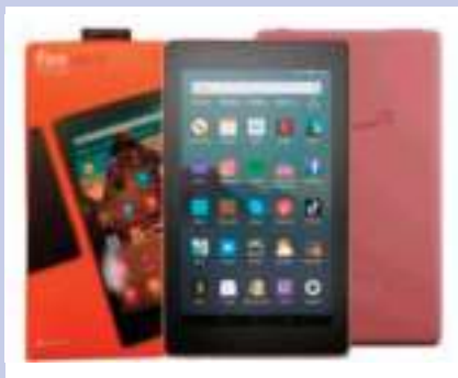
TABLET 10.1 AMAZON KINDLE FIRE HD 10 OCTACORE 2GHZ 2GB 32GB 1920X1200 WIFI DUAL BAND ALEXA EXPANDIBLE MICROSD HASTA 512 PLUM CONTADO $ 17.815 12 CTAS. DE $ 2.860