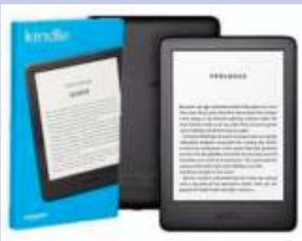
EBOOK READER AMAZON KINDLE 8GB TOUCHSCREEN WIFI 6 PULGADAS 167PPI DECIMA GENERACION NEGRO/BLANCO CONTADO $ 15.105 12 CTAS. DE $ 2.350