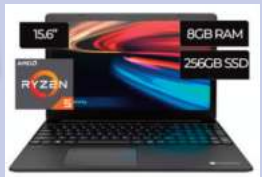
NOTEBOOK GATEWAY GWTN156 AMD RYZEN 5 3450U 2.1GHZ 8GB 256GB 1920X1080 15.6 PULGADAS WIN10 Y TECLADO EN INGLES NEGRA CONTADO $ 90.655 12 CTAS. DE $ 14.560