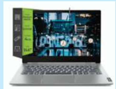
LENOVO V15 INTEL PENTIUM N5030 4GB 500GB PRECIO CONTADO $ 61.750