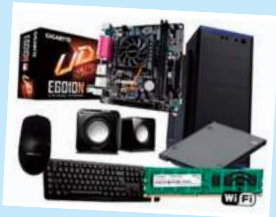
CPU KELYX AMD GIGABYTE GA-E6010N AMD E1-6010 1.35GHZ 4GB 240GB SSD WIFI VGA HDMI OFICINA INTERNET CON TECLADO MOUSE PAR- LANTES PRECIO CONTADO $ 26.400