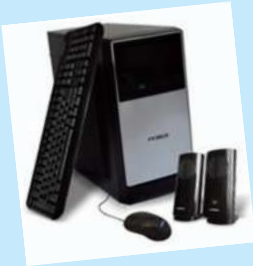
CPU ARMADA AMD HOGAR OFICINA MICRO AMD APU A6 7480 8GB RAM 240 SSD TECLADO MOUSE Y PARLANTES PRECIO CONTADO $ 28.500