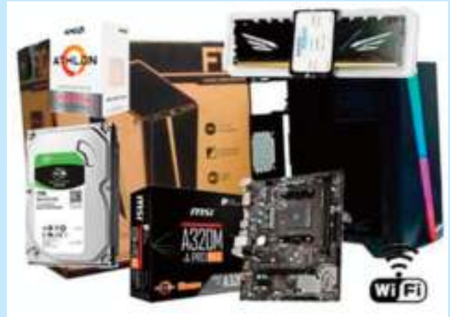
CPU SENTEY / NETMAK AMD ATHLON 320GE 3.4GHZ DVI-D HDMI VEGA GRAPHICS 3 WIFI GAMING GAMER SIN TECLADO MOUSE PARLANTES PRECIO CONTADO $ 45.365