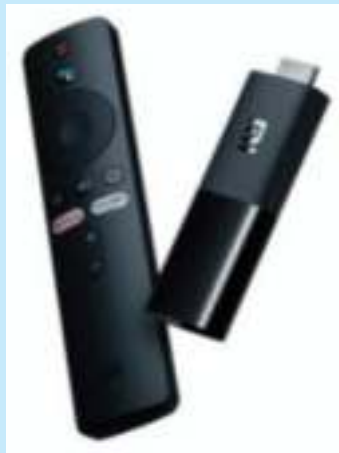
XIAOMI MI STICK TV WIFI 8GB HDMI 6 CTAS. DE $ 1.988