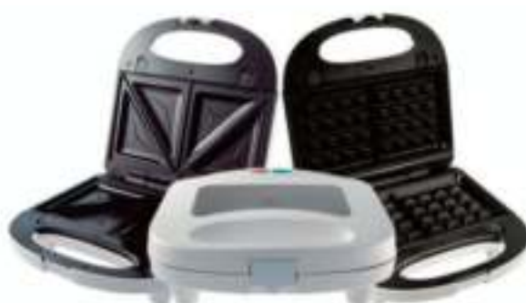
SANDWICHERA Y WAFFLERA SMARTLIFE 3 ctas. de $ 2.416