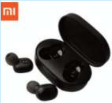
XIAOMI MI TRUE BASIC 2 BLUETOOTH 5.0 ORIGINAL EARBUDS INALAMBRICOS NEW VERSION 3 CTAS. DE $ 1.360