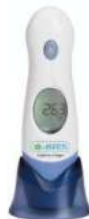
TERMOMETRO INFRARROJO ASPEN 6 ctas. de $ 1.398