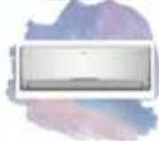
A.A. BS55CP Split 6500w FC Marca: BGH