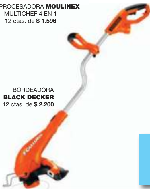
BORDEADORA BLACK DECKER 12 ctas. de $ 2.200