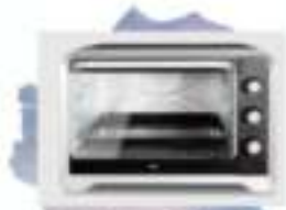
Horno Eléctrico KHC60C 60lts. Marca: R.C.A