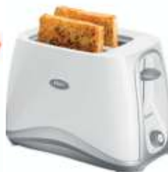
TOSTADORA OSTER 6 ctas. de $ 1.092