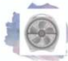
Turbocirculador 20" AXTURBL Alambre Marca: Axel