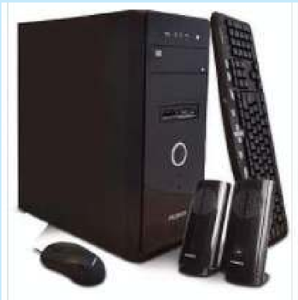
PC ARMADA PCBOX INTEL i3 10100 COMET LAKA RAM 8GB DISCO SSD 240GB FREE DOS 12 CTAS. DE $ 10.200