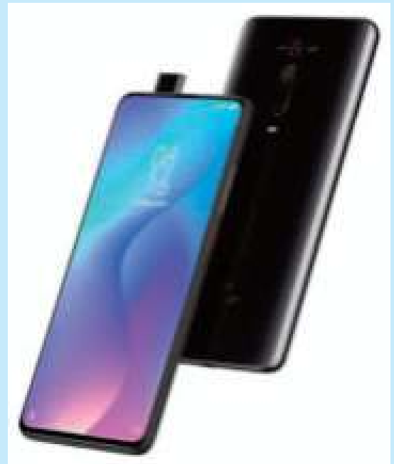
XIAOMI CELULAR LIBRE REDMI NOTE 9T 4GB 5G 12 CTAS. DE $ 9.200