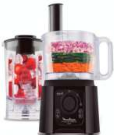
MULTIPROCESADORA MOULINEX MULTICHEF 4 EN 1 12 ctas. de $ 1.596