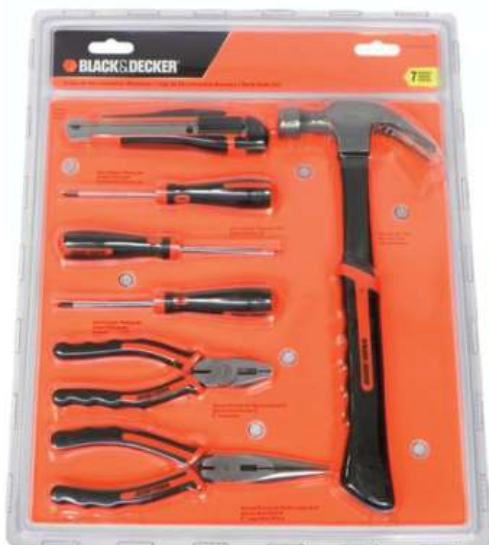
JUEGO DE HERRAMIENTAS BLACK+DECKER 3 CTAS. DE $ 981