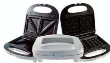
SANDWICHERA Y WAFLERA SMARTLIFE 6 CTAS. DE $ 1.379