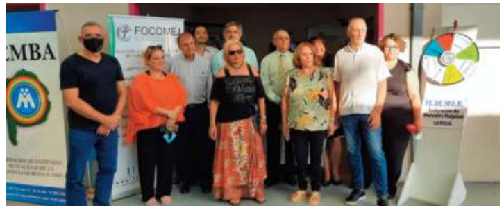
1- Equipo de trabajo con Federación de La Rioja y FOCOMEJ, Fondo Compensador Personal Civil del Ejército con el cual tenemos convenio intermutual.

Asimismo, las Comisiones de Género y Juventud de CONAM tuvieron una activa participación: recibiendo a quienes se acercaron al stand, respondiendo sus preguntas e inquietudes y mostrando el desarrollo de políticas de género y juventud que viene llevando adelante CONAM federalmente.