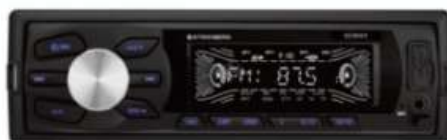
ESTEREO PARA AUTO STROMBERG 3 CTAS. DE $ 3.417