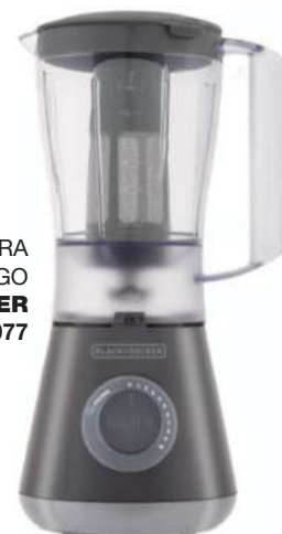
LICUADORA FILTRAJUGO BLACK+DECKER 9 CTAS. DE $ 1.077