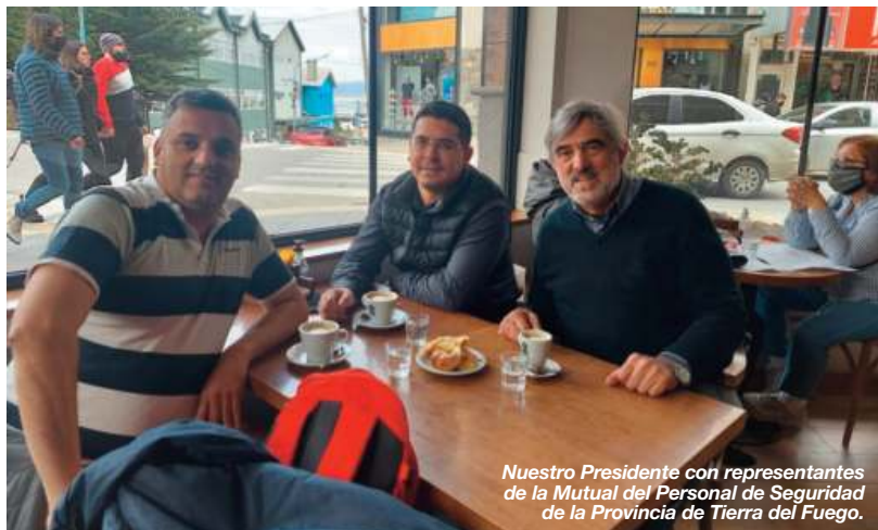
Nuestro Presidente con representantes de la Mutual del Personal de Seguridad de la Provincia de Tierra del Fuego.

Esperamos que próximamente se extienda el Programa del PRE VIAJE, el cual benefició y permitió reactivar el Turismo en todo nuestro país.