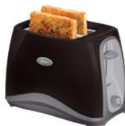
TOSTADORA OSTER 3 CTAS. DE $ 2.209