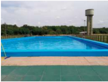
PUCARA XIII: Av. Gral. Ricchieri km 25.5 - (ex Camino Centro Atómico) EZEIZA