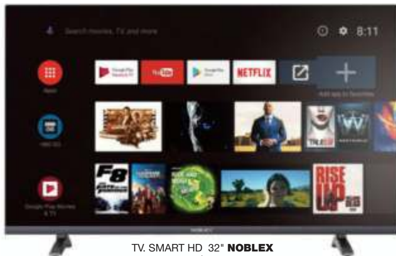
TV. SMART HD 32" NOBLEX 12 CTAS. DE $ 4.875