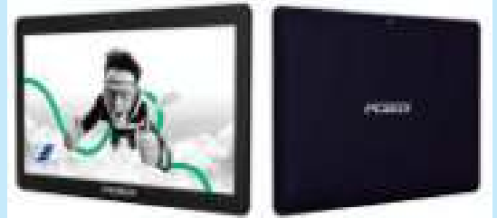
TABLET PCBOX FLASH PCB-T104 101 IPS 16GB 2 GB