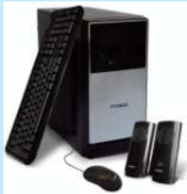
PCBOX CORE I5 COMET LAKE 8GB 240 SSD