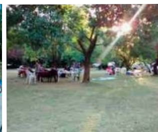
PUCARA XIII: Av. Gral. Ricchieri km 25.5 - (ex Camino Centro Atómico) EZEIZA