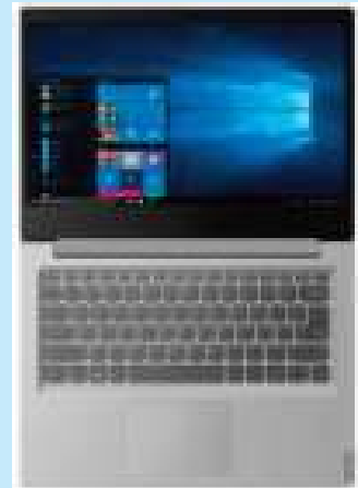
NOTEBOOK LENOVO IP S145-14API 3020E 4GB 500GB W10S