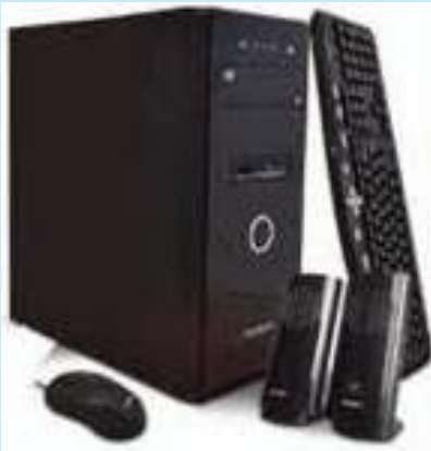
PC ARMADA PCBOX INTEL i3 10100 COMET LAKE RAM 8GB DISCO SSD 240GB FREE DOS