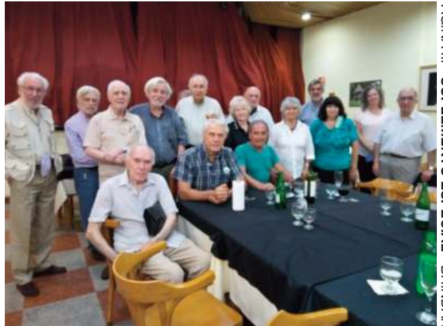
Participantes del Almuerzo.