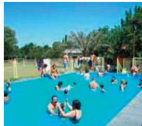
PUCARA XIV: Lomas de Marilo Av. Julio A. Roca 2778 - MORENO