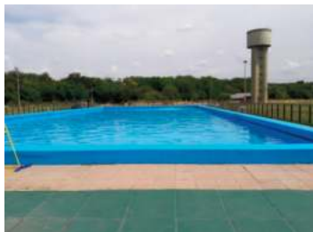
PUCARA XIII: Av. Gral. Ricchieri km 25.5 - (ex Camino Centro Atómico) EZEIZA

INGRESO CON CARNET FAMILIAR DE MUTUAL GAS INGRESO PREDIO - CONSULTAR VALOR INGRESO