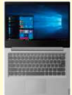
NOTEBOOK LENOVO IP S145-14API 3020E 4GB 500GB W10S