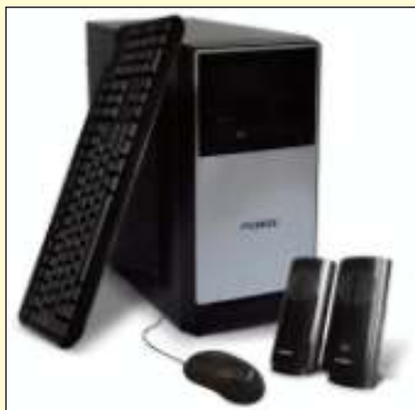
PCBOX CORE I5 COMET LAKE 8GB 240 SSD