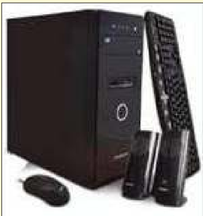
PC ARMADA PCBOX INTEL i3 10100 COMET LAKE RAM 8GB DISCO SSD 240GB FREE DOS