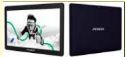
TABLET PCBOX FLASH PCB-T104 101 IPS 16GB 2 GB