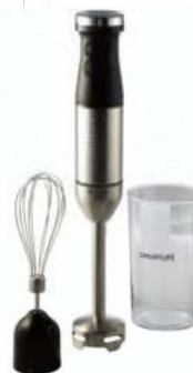
LICUADORA DE MANO SMART LIFE, 12 ctas. de $ 1.280