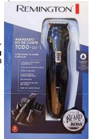
KIT DE CORTE DE BARBA Y DETALLES REMINGTON 6 CTAS. DE $ 988