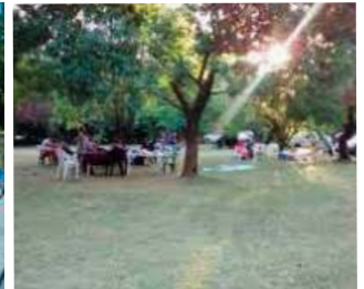
PUCARA XIII: Av. Gral. Ricchieri km 25.5 - (ex Camino Centro Atómico) EZEIZA