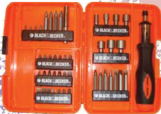
SET POR 45 PIEZAS BLACK DECKER 3 CTAS. DE $ 1.796