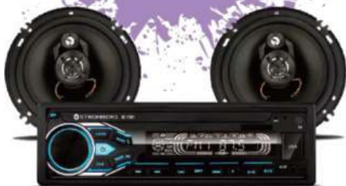
AUTOESTEREO CON PARLANTES STROMBERG 9 CTAS. DE $ 2.770