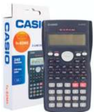
CALCULADORA CIENTIFICA CASIO 3 cuotas de $ 711