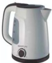
JARRA ELECTRICA SMARTLIFE MODELO SL -EK1714W- BLANCO 9 cuotas de $ 818

RELOJES TRESSA ORIENT - SEIKO - CASIO LORUS - KVN