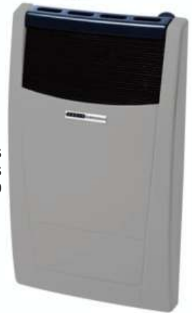
CALEFACCION A GAS 2700 CALORIAS ORBIS 12 CTAS. $ 3.510