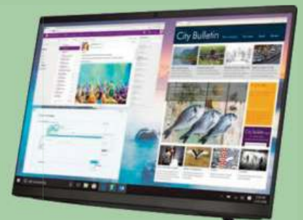
ALL IN ONE LENOVO IC 3