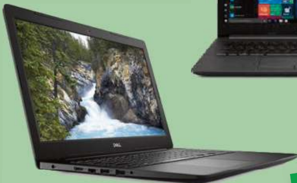
NOTEBOOK DELL INSPIRON 15-3583