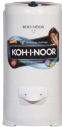
SECARROPA KOH-I-NOOR 6.5 KG. 12 CTAS. DE $ 2.990