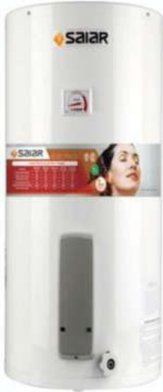
TERMOTANQUE SAIR 80 LTS. MULTIGAS 12 CTAS. DE $ 5.860