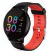
RELOJ SMARTWATCH HAVIT MODELO H1113A COLOR NEGRO CON ROJO 6 cuotas de $ 1.557

INGRESÁ EN NUESTRA PÁGINA www.rogar.com.ar