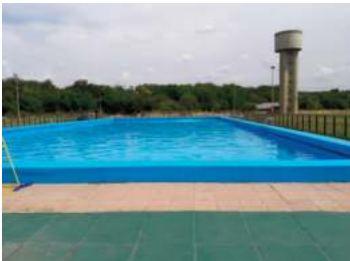
PUCARA XIII: Av. Gral. Ricchieri km 25.5 - (ex Camino Centro Atómico) EZEIZA

INGRESO PREDIO - CONSULTAR VALOR INGRESO