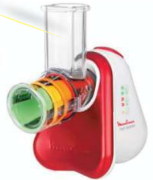
RALLADOR MOULINEX 12 CTAS. DE $ 3.331

IMPORTANTE Los socios de MutualGas tienen un 5 % de descuento sobre cualquier producto publicado en nuestra tienda virtual.