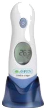
TERMOMETRO INFRAROJO ASPEN 6 CTAS. DE $ 1.132