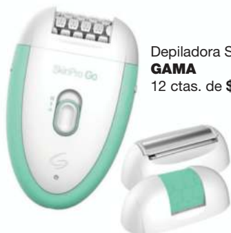
Depiladora Skin Pro GAMA 12 ctas. de $ 1.443