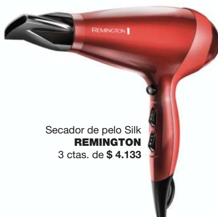
Secador de pelo Silk REMINGTON 3 ctas. de $ 4.133