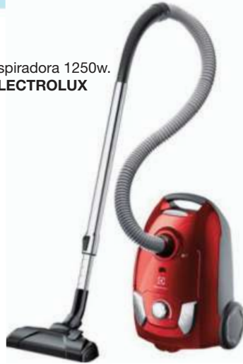
Aspiradora 1250w. ELECTROLUX