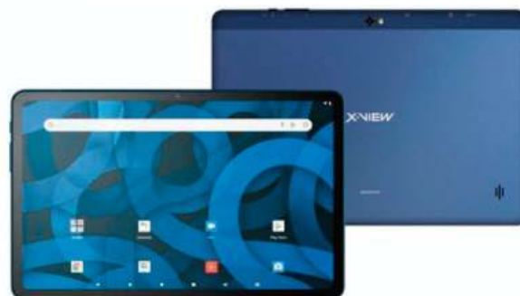
Tablet Q10 64 GB. X VIEW 12 ctas. de $ 5.310