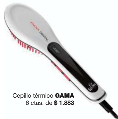
Cepillo térmico GAMA 6 ctas. de $ 1.883