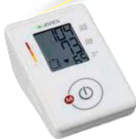
TENSIOMETRO DIGITAL DE BRAZO ASPEN 6 CTAS. DE $ 2.624