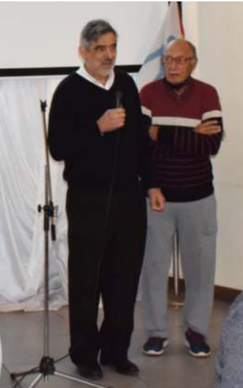
PALABRAS DE APERTURA