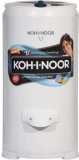
Secarropas 6.5 Kgs. Blanco KOH-I-NOOR