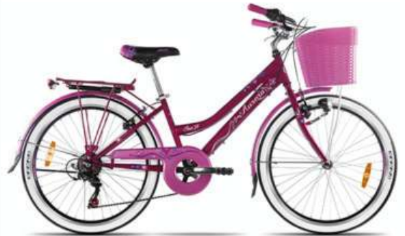
Bici Rod.24 AURORA

CONSULTE PRECIOS, STOCK SUJETO A MODIFICACION