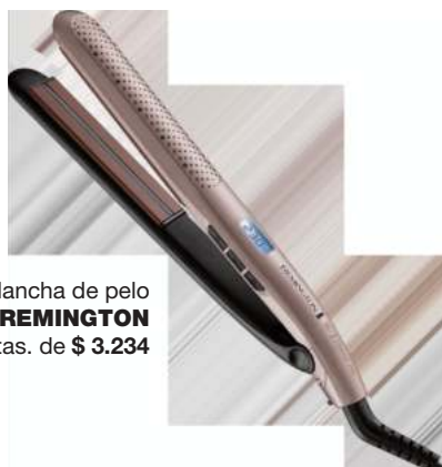
Plancha de pelo REMINGTON 3 ctas. de $ 3.234