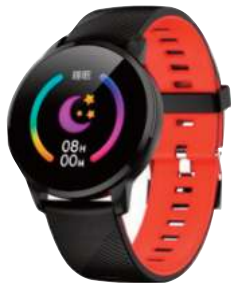
SMART WATCH HAVIT 6 CTAS. DE $ 2.107

RELOJES TRESSA ORIENT - SEIKO - CASIO LORUS - KVN