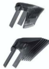
CORTADORA DE CABELLO INALAMBRICA REMINGTON 12 CTAS. DE $ 899