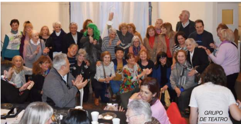
GRUPO DE TEATRO