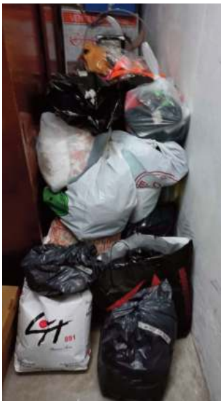
BOLSAS CON ROPA DONADA POR LOS ASOCIADOS DE MUTUAL GAS.

Hacemos llegar a nuestros Asociados la GRATITUD de quienes trabajan permanentemente en la Fundación y en el Comedor Los Piletones.