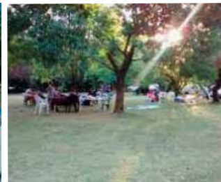
PUCARA XIII: Av. Gral. Ricchieri km 25.5 - (ex Camino Centro Atómico) EZEIZA