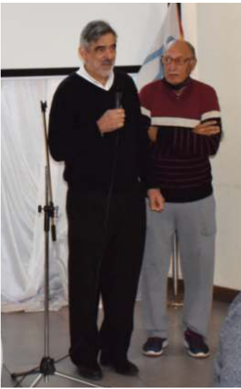
PALABRAS DE APERTURA