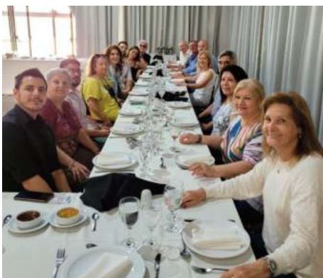
INTEGRANTES DE LA CONAM ENTRE LOS QUE SE ENCUENTRAN EL PRESIDENTE Y LA TESORERA DE MUTUAL GAS.