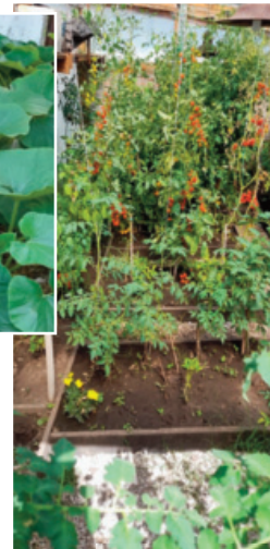
Tomates Redondos y en invernadero tomatitos Cherry