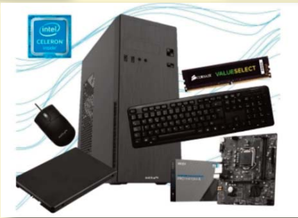
PC KELYX AMD RYZEN 3-3200G 8G SSD 240GB (GIGA)

CONSULTE PRECIOS Y FINANCIACION. - STOCK SUJETO A MODIFICACIÓN