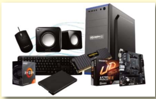
PC KELYX AMD RYZEN 5-4600G 8G SSD 480GB (GIGA)