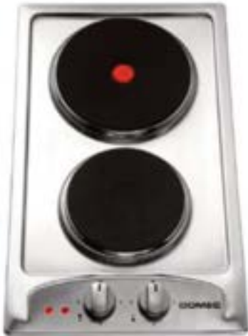
Anafe GE-30 2 Placas, Eléctrico DOMEC