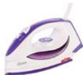
PLANCHA A VAPOR OSTER

CONSULTE PRECIOS / STOCK SUJETO A MODIFICACION