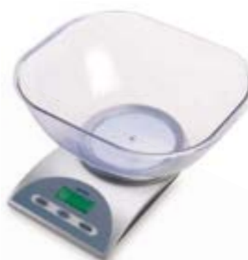
BALANZA DE COCINA DIGITAL ASPEN