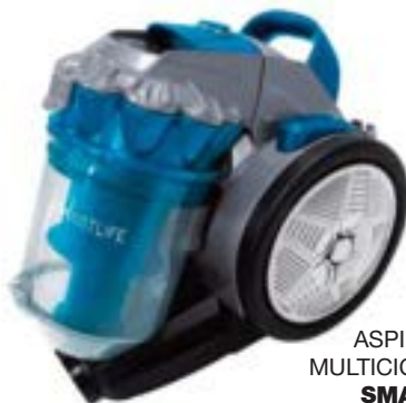
ASPIRADORA MULTICICLONICA SMARTLIFE