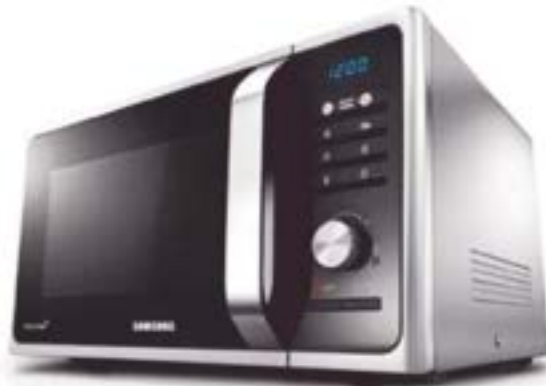
Microondas 28lts. Grill SAMSUNG