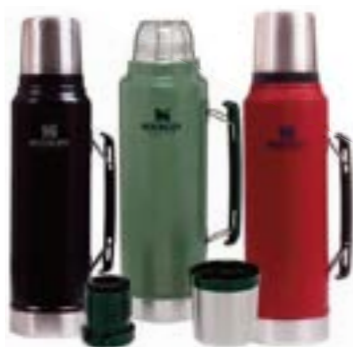
TERMO STANLEY CLASSIC 950 ML.