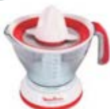
EXPRIMIDOR MOULINEX 1 Litro.