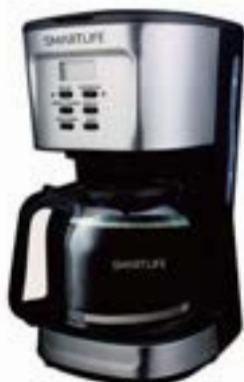
CAFETERA CON FILTRO DIGITAL SMARTLIFE

RELOJES TRESSA ORIENT - SEIKO - CASIO LORUS - KVN