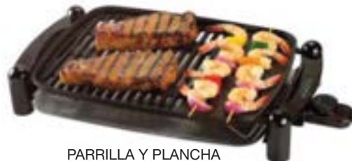
PARRILLA Y PLANCHA BLACK+DECKER

CONSULTE PRECIOS / STOCK SUJETO A MODIFICACION