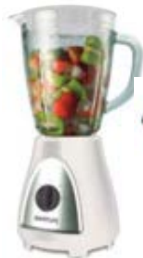
LICUADORA SMARTLIFE Jarra de vidrio 2 velocidades