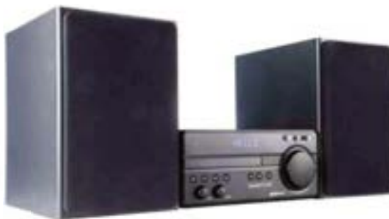
MINICOMPONENTE SMARTLIFE 100 Wats Bluetooth