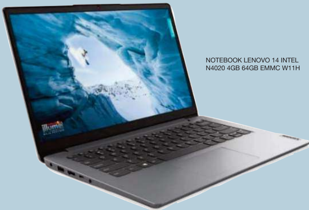
NOTEBOOK LENOVO 14 INTEL N4020 4GB 64GB EMMC W11H