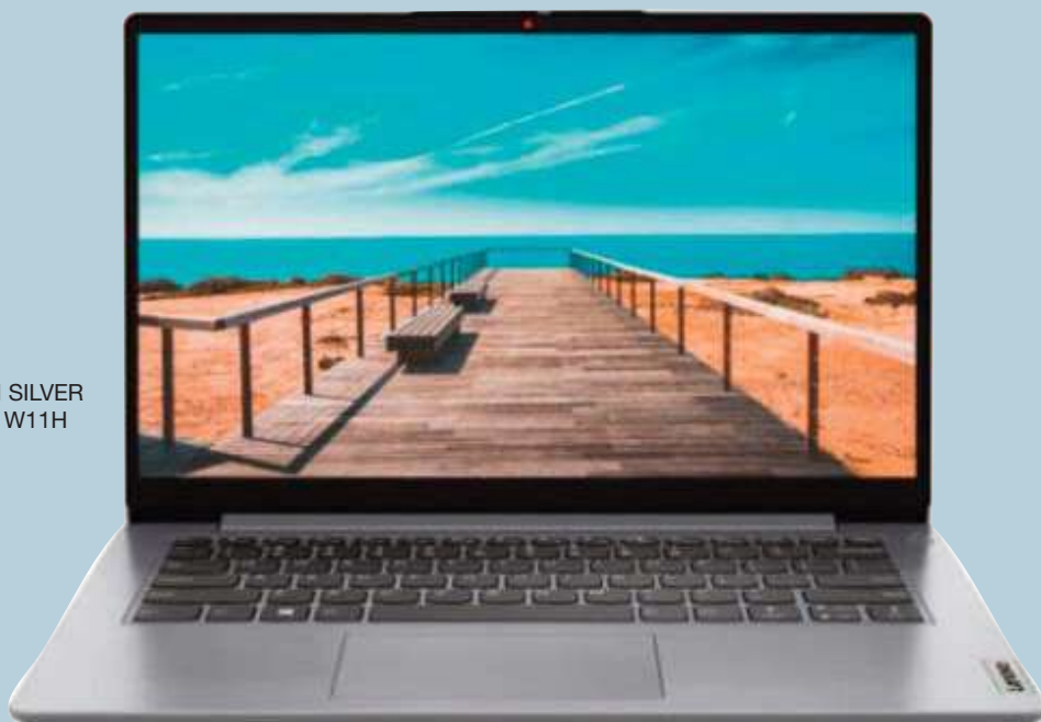
NOTEBOOK LENOVO 14 PENTIUM SILVER N5030 1.1GHZ 4GB 128GB EMMC W11H

CONSULTE PRECIOS Y FINANCIACION. STOCK SUJETO A MODIFICACION