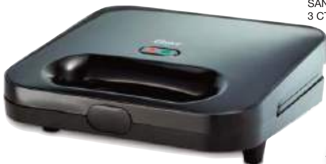
SANDWICHERA OSTER 3 CTAS. DE $ 20.559