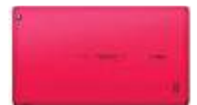
TABLET W-VIEX 10" 12 ctas. de $ 27.691