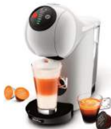
Cafetera Dolce Gusto Genio Expresso Moulinex

CONSULTE PRECIOS, STOCK SUJETO A MODIFICACION