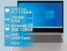
NOTEBOOK LENOVO 1