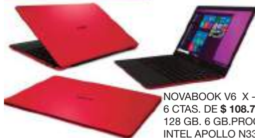
NOVABOOK V6 X-VIEW 14" 6 CTAS. DE $ 108.726 128 GB. 6 GB. PROCESADOR INTEL APOLLO N3350