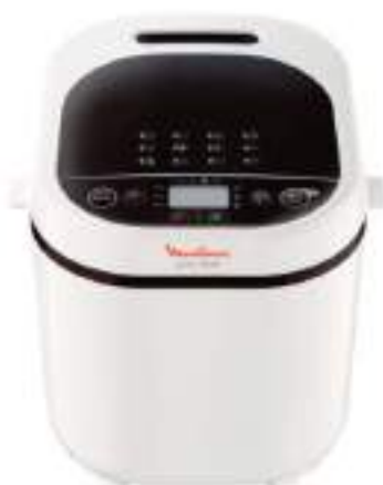
Horno De Pan Dore Moulinex