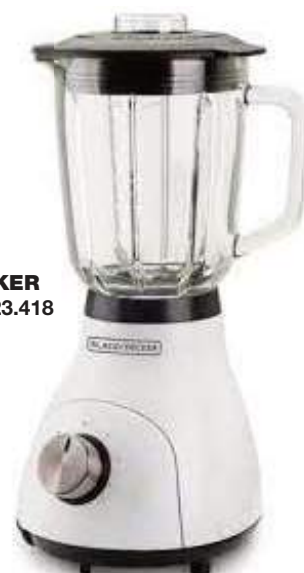
LICUADORA BLACK+DECKER 6 CTAS. DE $ 23.418