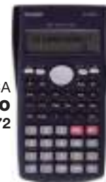
CALCULADORA CIENTIFICA CASIO 3 ctas. de $ 7.872