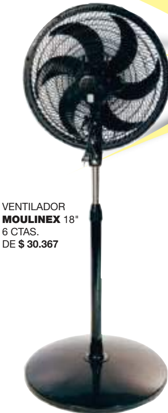
VENTILADOR MOULINEX 18" 6 CTAS. DE $ 30.367

RELOJES TRESSA ORIENT - SEIKO - CASIO LORUS - KVN