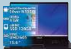
NOTEBOOK LENOVO 3