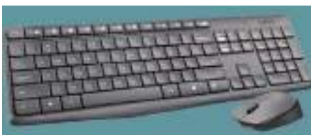
TECLADO Y MOUSE LOGITECH 12 ctas. de $ 12.615