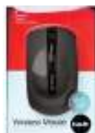
MOUSE INALAMBRICO HAVIT 3 ctas. de $ 5.414