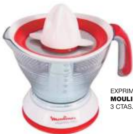
EXPRIMIDOR VITAPRESS MOULINEX 3 CTAS. DE $ 14.345