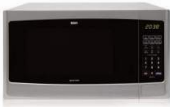
Microondas 23 lts. Sil. Grill BGH