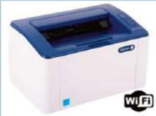
IMPRESORA XEROX PHASER 3020 LASER WIFI MONOCROMATICA