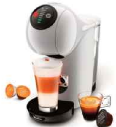
Cafetera Dolce Gusto Genio Espresso Moulinex

CONSULTE PRECIOS, STOCK SUJETO A MODIFICACION