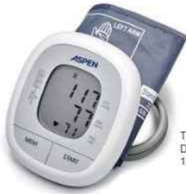
TENSIOMETRO DIGITAL DE BRAZO ASPEN 12 CTAS. DE $ 10.635