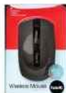
MOUSE INALAMBRICO HAVIT 3 ctas. de $ 5.414