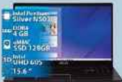
NOTEBOOK LENOVO 3