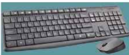
TECLADO Y MOUSE LOGITECH 12 ctas. de $ 12.615