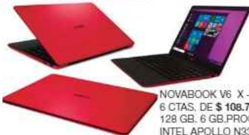
NOVABOOK V6 X-VIEW 14" 6 CTAS. DE $ 108.726 128 GB. 6 GB. PROCESADOR INTEL APOLLO N3350

NOTEBOOK ENOVA 14" 6 CTAS. DE $ 91.831 PROCESADOR INTEL CELERON 4020 4 GB. SSD. 128GB.