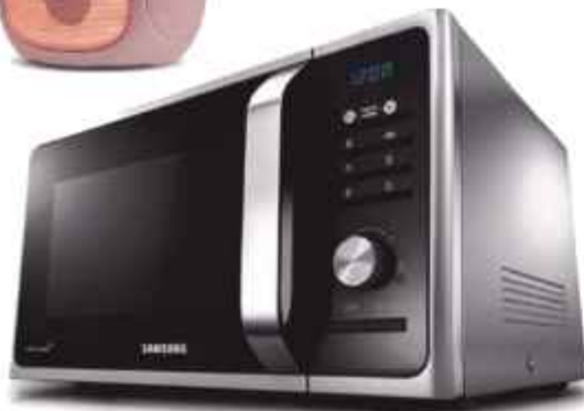
HORNO MICROONDAS SAMSUNG 23 LITROS 12 CTAS. DE $ 48.699