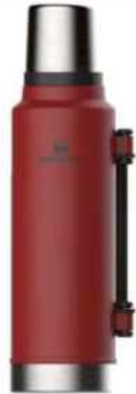
TERMO STANLEY CLASSIC BOTTLE 0.95 L 12 CTAS. DE $ 19.344

CONSULTE PRECIOS / STOCK SUJETO A MODIFICACION