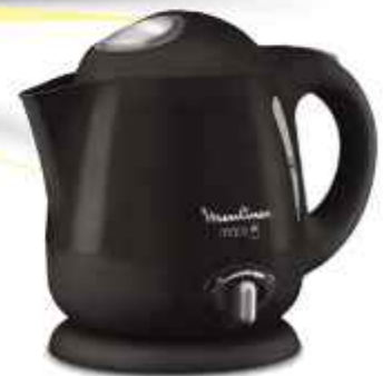
JARRA ELECTRICA MOULINEX 1 L. 6 CTAS. DE $ 19.015