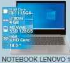
NOTEBOOK LENOVO 1