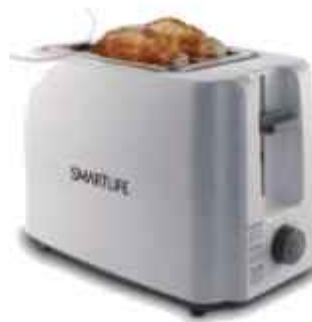
TOSTADORA SMARTLIFE 3 CTAS. DE $ 13.766

CONSULTE PRECIOS STOCK SUJETO A MODIFICACION