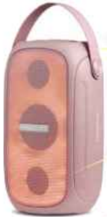
PARLANTE SMARTLIFE 55 W. 9 CTAS. DE $ 51.600

RELOJES TRESSA ORIENT - SEIKO - CASIO LORUS - KVN