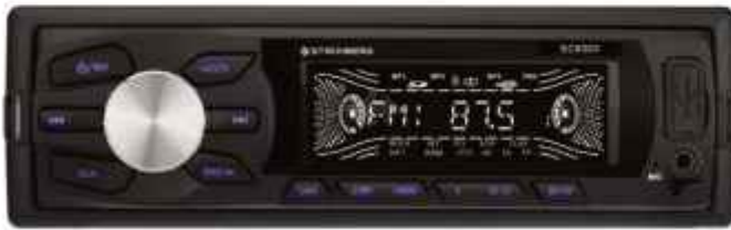
AUTOESTEREO STROMBERG Bluetooth 6 CTAS. DE $ 24.015

CONSULTE PRECIOS / STOCK SUJETO A MODIFICACION