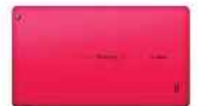
TABLET W-VIEX 10" 12 ctas. de $ 27.691