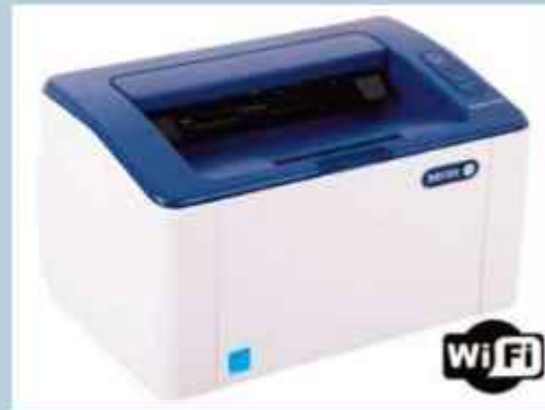
IMPRESORA XEROX PHASER 3020 LASER WIFI MONOCROMÁTICA