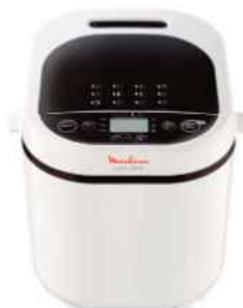
Horno De Pan Dore Moulinex