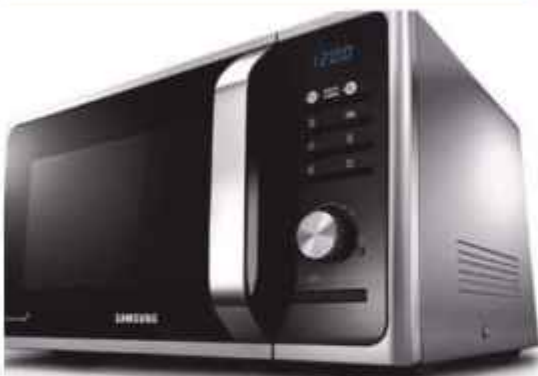
Microondas 23 lts. Sil. Grill BGH