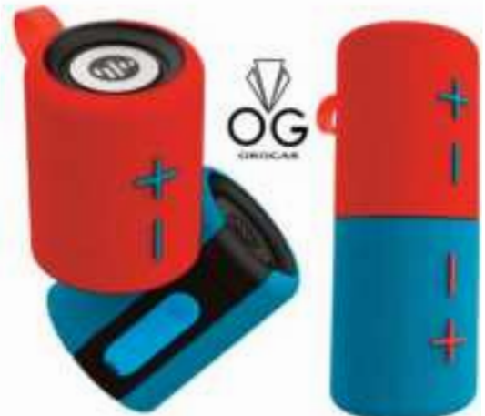
PARLANTE PORTATIL 2 EN 1 STROMBERG 12 CTAS. DE $ 11.822

CONSULTE PRECIOS - STOCK SUJETO A MODIFICACION