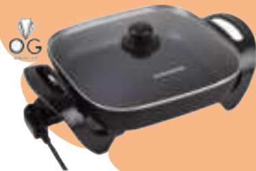
SARTEN/OLLA ELECTRICA DAIHATSU 12 CTAS. DE $ 7.088