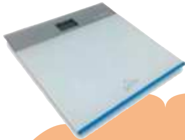
BALANZA DE BAÑO FIT CARE GAMA 12 CTAS. DE $ 4.556