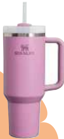
VASO STANLEY 887 ML. 12 CTAS. DE $ 14.792