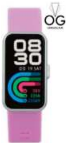
RELOJ SMART MISTRAL 12 CTAS. DE $ 8.639