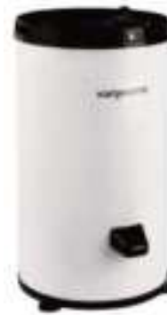
Secarropas 6KG Silver KANJI