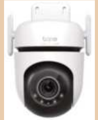
TAPO C520WS Camara IP 2K Mov Remoto Night Color