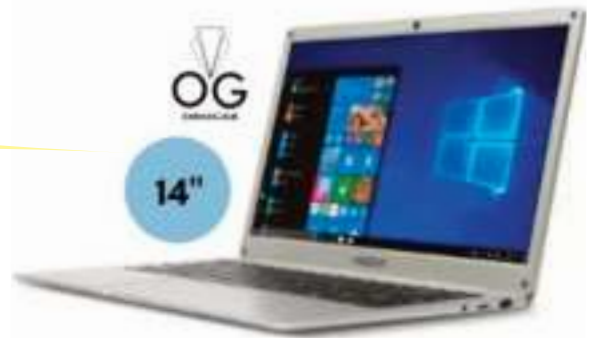
NOTEBOOK ENOVA N4020 14" 12 CTAS. DE $ 43.561

ELECTRODOMESTICOS - NOTEBOOKS - TABLETS CELULARES - SMARTWATCHES- AUDIO CUIDADO PERSONAL - TV - SEGURIDAD HOGAR HERRAMIENTAS - VENTILACION Y MUCHOS PRODUCTOS MAS.