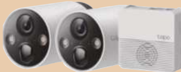
TAPO C420S2 Sistema 2 Camaras IP a Bateria Ext Day/Night + HUB