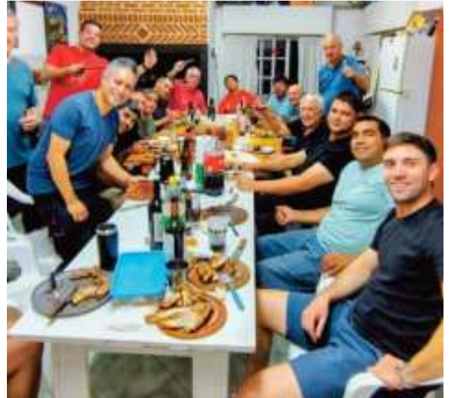
Festejando el Día del Gas en la localidad de Godoy, Alto Valle de Río Negro. La mayoría de la gente eran de Planta Chelforó.