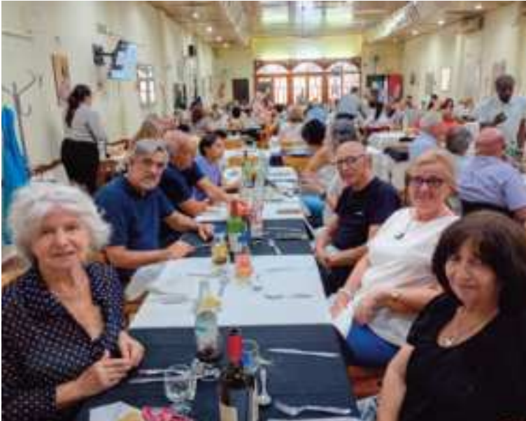
Día del Gas festejo en el Restaurante Tuy Salceda en CABA.