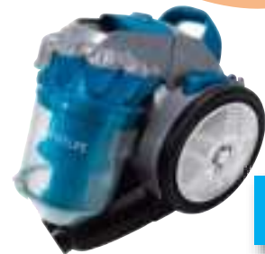
ASPIRADORA MULTICI-CLONICA SMARTLIFE 12 CTAS. DE $ 20.353