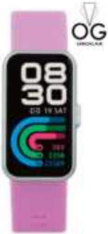
RELOJ SMART MISTRAL 12 CTAS. DE $ 8.639