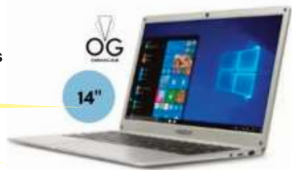
NOTEBOOK ENOVA N4020 14" 12 CTAS. DE $ 43.561

ELECTRODOMESTICOS - NOTEBOOKS - TABLETS CELULARES - SMARTWATCHES- AUDIO CUIDADO PERSONAL - TV - SEGURIDAD HOGAR HERRAMIENTAS - VENTILACION Y MUCHOS PRODUCTOS MAS.