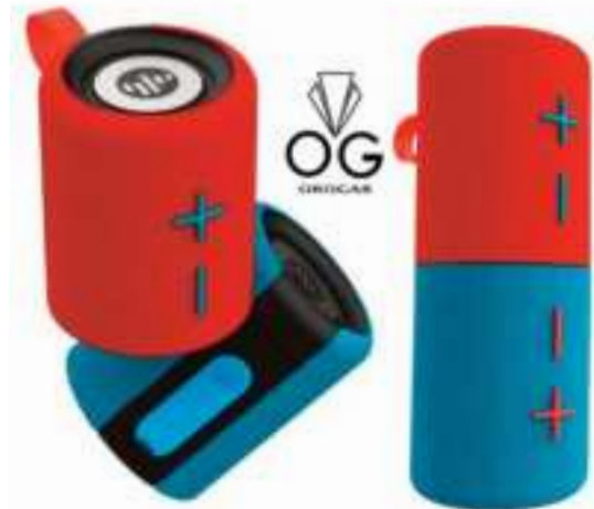
PARLANTE PORTATIL 2 EN 1 STROMBERG 12 CTAS. DE $ 11.822

CONSULTE PRECIOS - STOCK SUJETO A MODIFICACION