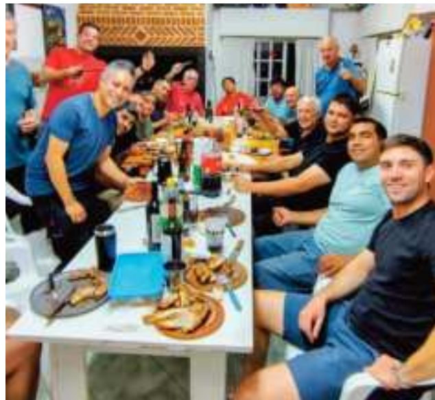
Festejando el Día del Gas en la localidad de Godoy, Alto Valle de Río Negro. La mayoría de la gente eran de Planta Chelforó.