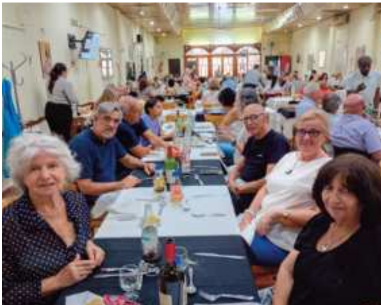
Día del Gas festejo en el Restaurante Tuy Salceda en CABA.