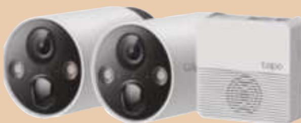
TAPO C420S2 Sistema 2 Camaras IP a Bateria Ext Day/Night + HUB