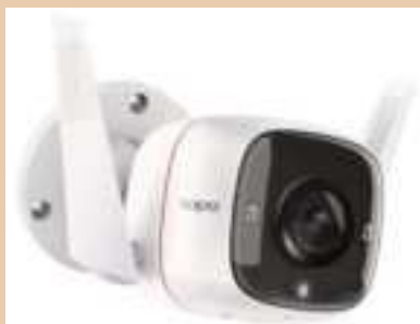
TAPO C310 Camara IP Day/Night SD Wifi Exterior