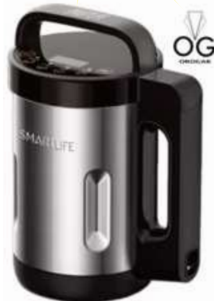
SOPERA ELECTRICA SMARTILFE 12 CTAS. DE $ 18.933